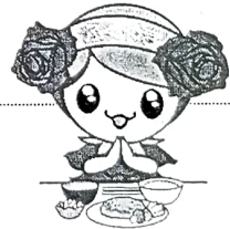
ばらのまち福山イメージキャラクター 「フレイル予防ローラ」

※締め切りは、実施日の1週間前までとさせていただきます。お早めに申込みをお願いします。 ※申込が5人未満の場合は、中止します。その場合は、食生活改善推進員から連絡させていただきます。